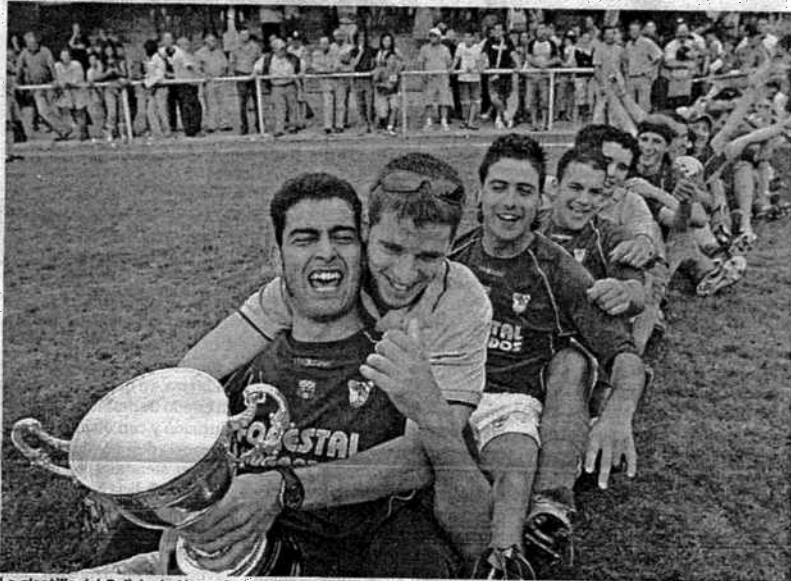
La plantilla del Galicia de Mugardos exhibe el trofeo que lo acredita como campeón.