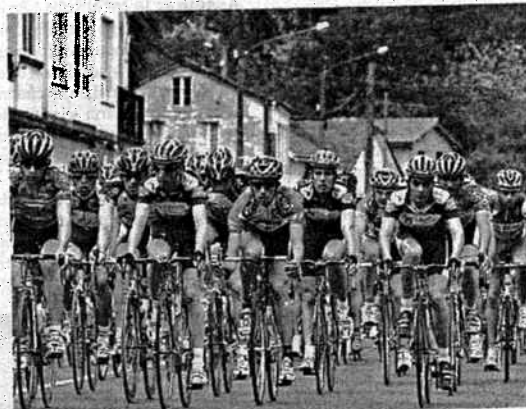
El pelotón rodó unido hasta que se iniciaron las subidas