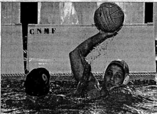
El Marín disputará sus encuentros en la piscina de Caranza

Las instalaciones del club Campomar de golf acogerán hoy la primera edición del torneo Bouza Car. La competición se disputará en la modalidad de "stableford", agrupando a los participantes en tres categorías según su "hándicap". La organización ha programado una salida a las 09.00 y otra a las 14.00 horas en función de la tarjeta de los deportistas inscritos.