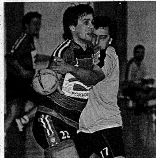
Los locales sufrieron en la parte final del encuentro.

Esta fue la principal razón por la que la ventaja de los locales era casi constantemente recortada por el Lalín a pesar de que el Narón estuviese realizando un juego más efectivo, tanto en ataque como en defensa. Precisamente esta falta de seguridad sobre la cancha pudo costarle a los de Ferrolterra el triunfo puesto que con una renta sobre su rival de cuatro tantos (28-24), vinieron cinco minutos de infarto defendiendo su primera victoria de la liga. Los locales fallaron cuatro ocasiones de gol