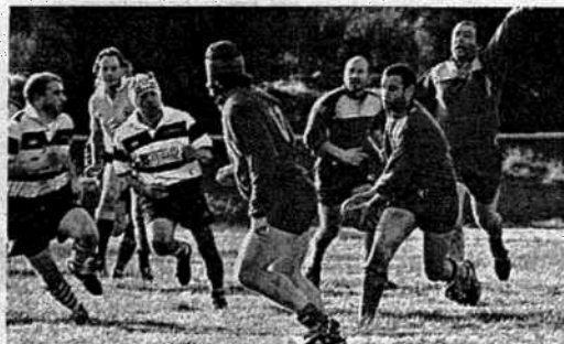
Os ponteses disputarán o seu último choque ligueiro

Con todo decidido, o técnico local dará minutos os menos habituais, malia que os lucenses tentarán demostrar por que eran un dos equipos favoritos. Se a isto engadimos a tradicional rivalidade entre estas dúas escadras, o partido no Monte Medulio presentase moi interesante. O Fendetestas podera recuperar para este choque a