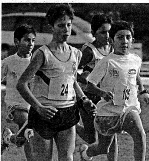
Nada menos que quince equipos locales lograron una plaza

Però no fue el único club en clasificarse a sus atletas. El equipo Sierra Narón, por ejemplo, fue segundo en el cuadro infantil y primero en el alevín, ambos femeninos, y clasificó también a su grupo