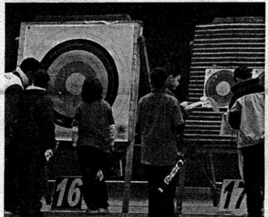
La nieve impidió la llegada de algunos deportistas