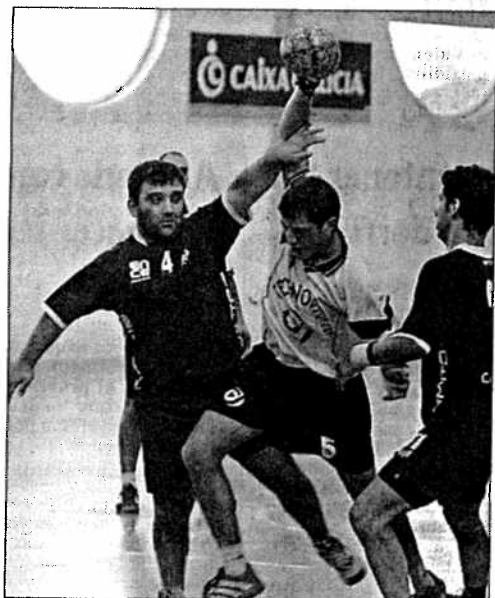
El Technovideo eumés venció el pasado sábado al Martín / Luis Polo

Technovideo Pontedeume y Club Narón de balonmano afrontarán mañana la segunda jornada de la Copa Galicia, competición con la que el pasado fin de semana se daba el pistoletazo de salida a la nueva temporada competitiva en la Segunda División Nacional masculina. El de este fin de semana será el segundo de los tres encuentros que los dos conjuntos de Ferrolterra tendrán que dirimir correspondientes a la primera ronda del torneo, que se ha estructurado en cuatro grupos -dos de cuatro equipos y otros tantos de tres-. De esta tanda inicial se clasificarán para la siguiente eliminatoria los dos primeros conjuntos de cada uno de los grupos.