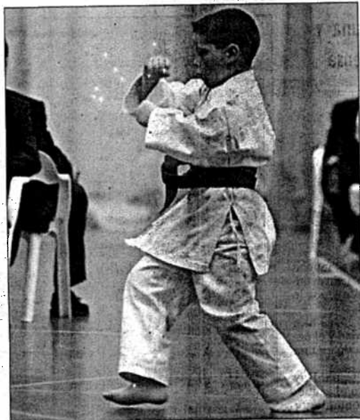
A partir de las próximas semanas se retoma el deporte escolar

✓ Natación: En apenas unas semanas, los nadadores de la comarca se echarán al agua