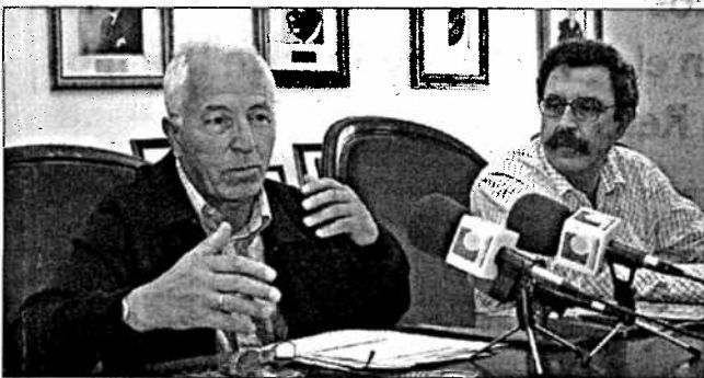
El presidente de la Federación Gallega, Sergio Vázquez, con el edil de Deportes, Ibáñez / Jorge Meis

El Patronato ha dispuesto en A Malata unas gradas supletorias con capacidad para 800 personas dado que la cita reunirá a un elevadísimo número de participantes y espectadores. Las pruebas se desarrollarán en horario de 9.30 a 12.45 y de 16.30 a 21.20 el sábado, así como de 10.00 a 11.55 y de 17.00 a 20.10 el domingo.