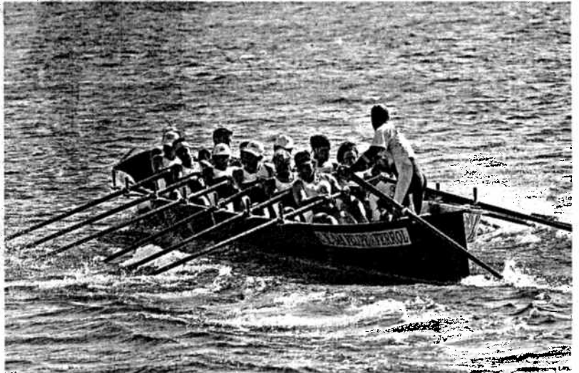
La embarcación del club de remo San Felipe no consiguió clasificarse para la final de esta mañana

Estas diez embarcaciones se clasificaron para la final de las doce de esta mañana, del