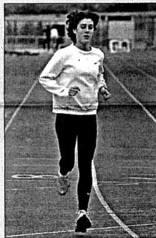
La velocista -izquierda- y la fondista -derecha-, bazas de Galicia para subir al podium