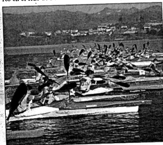
Esta cita nacional tendrá continuidad hoy con la regata de 500 metros