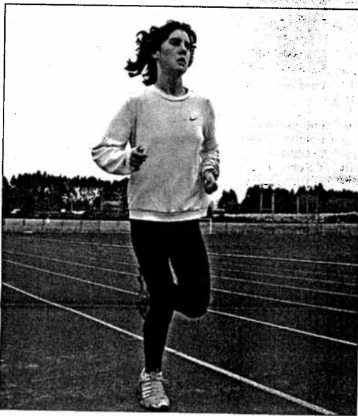
La deportista del Ría Ferrol, en un entrenamiento en Río Seco