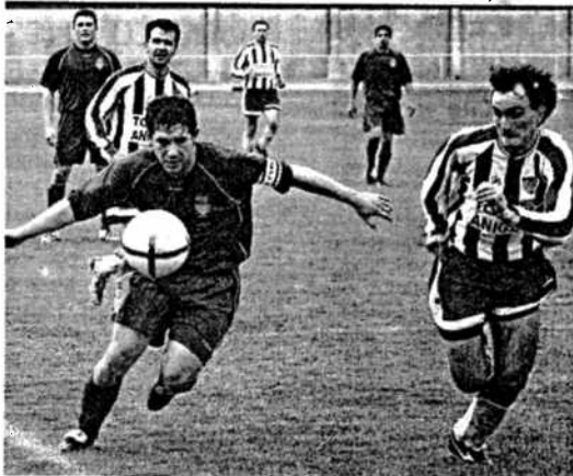
Los naroneses han trabajado duro para lograr salvarse