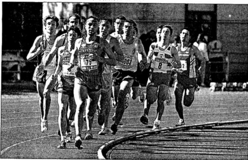
Un momento de una de las pruebas del Memorial Francisco Castro.