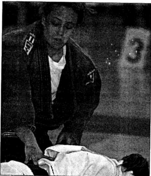
La judoka venció los emparejamientos por ippon en la repesca y semifinales

La componente del Bitácora sólo cedió contra la campeona