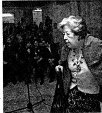
La escritora sevillana a su llegada al acto / C. Carbalero