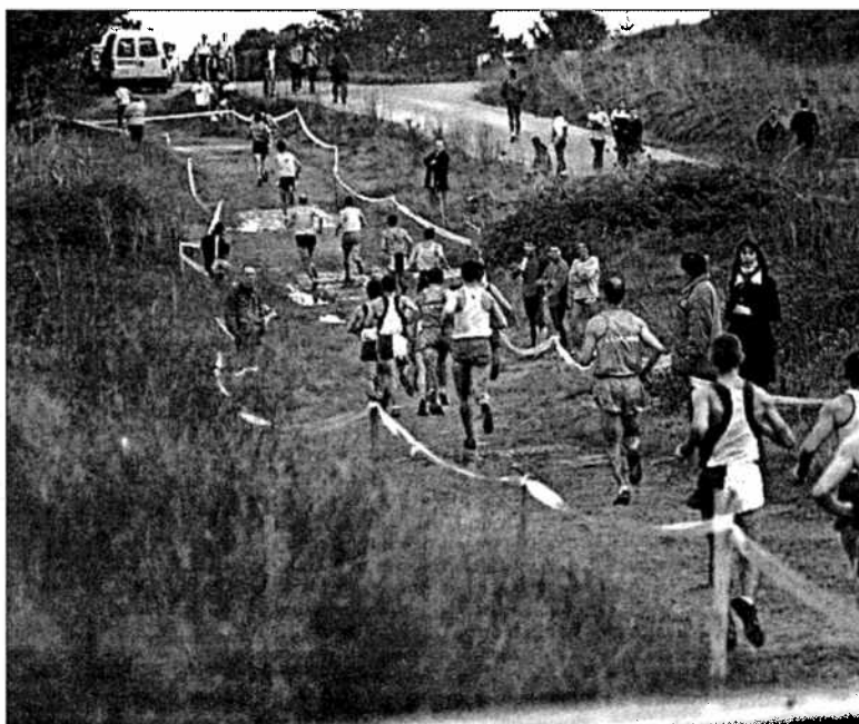
El circuito de Monte do Gozo tiene un recorrido de doce kilómetros para la prueba senior

Previamente a la disputa, el domingo por la mañana, en