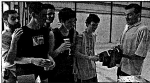
La fiesta de fin de temporada del CB Galicia tuvo lugar en FIMO

zará cedo, ás 8.30 horas, momento no que os participantes se concentrarán en Casa Urbano de Castiñeiras, lugar de onde se desprazarán á Serra de Faladoira, no couto de caza de Ortegal, que será o escenario da competición. De novo en Casa Urbano terá lugar o xantar e posteriormente a entrega de trofeos do campionato galego.