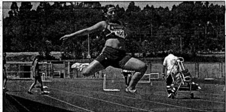
El buen tiempo acompañó ayer la celebración de la prueba en las pistas naronesas de Río Seco

de final de temporada para todos los equipos de base de la entidad departamental. Además de demostrar sus habilidades bajo los aros, los jugadores de las distintas categorías protagonizaron diversos partidos antes de iniciar las tan ansiadas vacaciones.