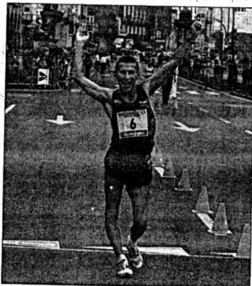
El polaco intentará ahora doblegar a Paquillo en Cracovia