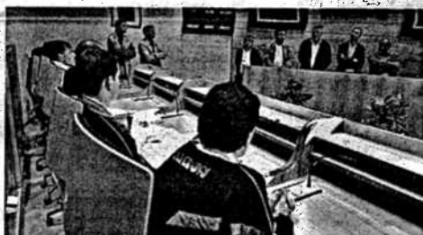
Los naroneses acudieron ayer al salón de plenos