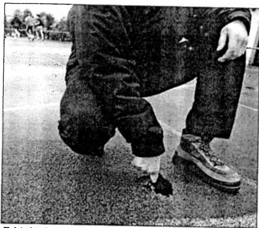
El deteriorado estado del tartam ha sido paliado hasta ahora con parches