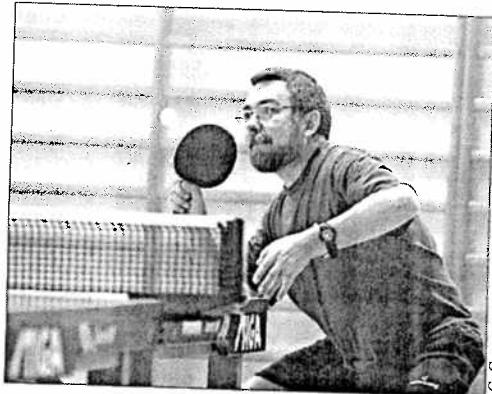
El club departamental superó casi todos sus compromisos

En lo que se refiere al Tenis de Mesa Ferrol, esta última jornada ha sido una de las más positivas de la presente campaña, con victoria del equipo de Segunda División masculina -cuatro a dos ante el Castrillón de Asturias-, Di-